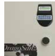
Bloqueo mediante cerradura electrónica, con función retardo y bloqueo y cerradura de llave de gorjas. Clase B EN-1300.

Blocked by electronic lock and double bitted keylock. Class B EN-1300.