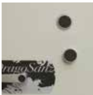
Bloqueo mediante doble cerradura de llave de gorjas. Clase B EN-1300.

Blocked by double bitted keylock. Class B EN-1300.