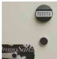
Bloqueo mediante cerradura electrónica programable y cerradura de llave de gorjas. Clase B EN-1300.

Blocked by double bitted keylock. Class B EN-1300.