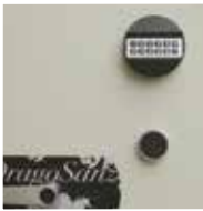
Bloqueo mediante cerradura electrónica programable y cerradura de llave de gorjas. Clase B EN-1300.

Blocked by electronic lock and double bitted keylock. Class B EN-1300.