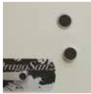
Bloqueo mediante doble cerradura de llave de gorjas. Clase B EN-1300.

Blocked by electronic lock and double bitted keylock. Class B EN-1300.