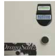
Bloqueo mediante cerradura electrónica, con función retardo y bloqueo y cerradura de llave de gorjas. Clase B EN-1300.

Blocked by double bitted keylock. Class B EN-1300.